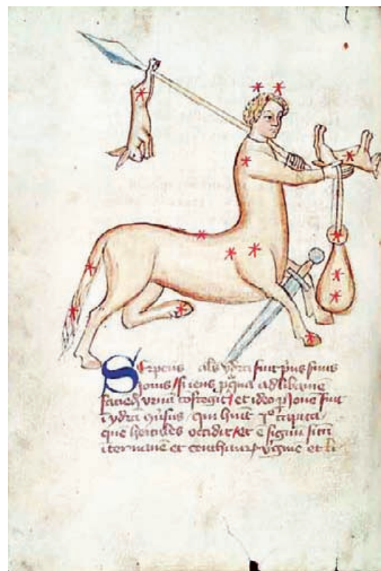
fol. 45v: Kresba Kentaura (a jeho hvězdného znamení)

Odhadovaná cena umělecké kopie je 270 000 Kč