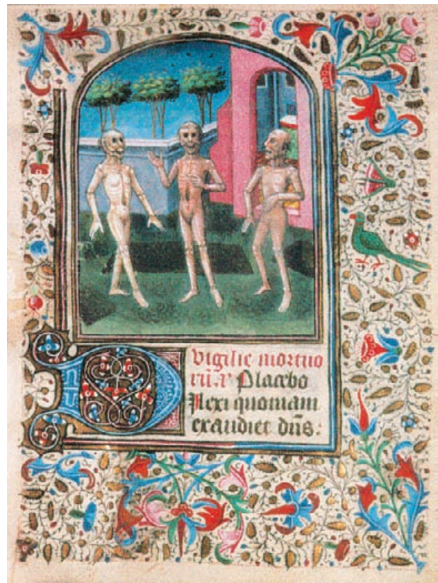
fol. 208r: Výjev inspirovaný „tancem smrti“, v noční krajině tančí na hřbitově tři rozkládající se mrtvoly kolem svých hrobů

Odhadovaná cena umělecké kopie je 370 000 Kč