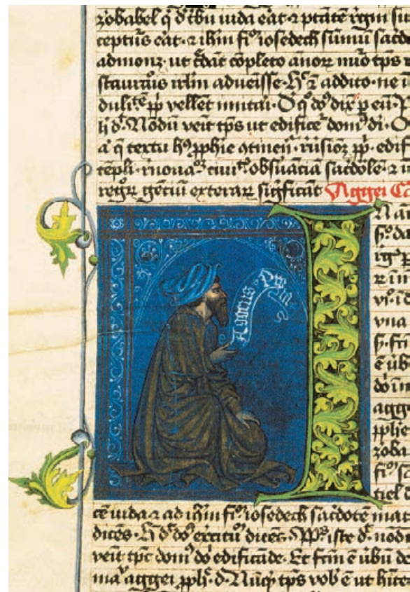
fol. 253v: Prorok Aggeus

Odhadovaná cena umělecké kopie je 370 000 Kč