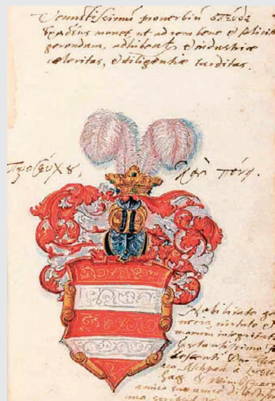
fol. 13r: Erb Václava Budovce z Budova

Odhadovaná cena umělecké kopie je 250 000 Kč