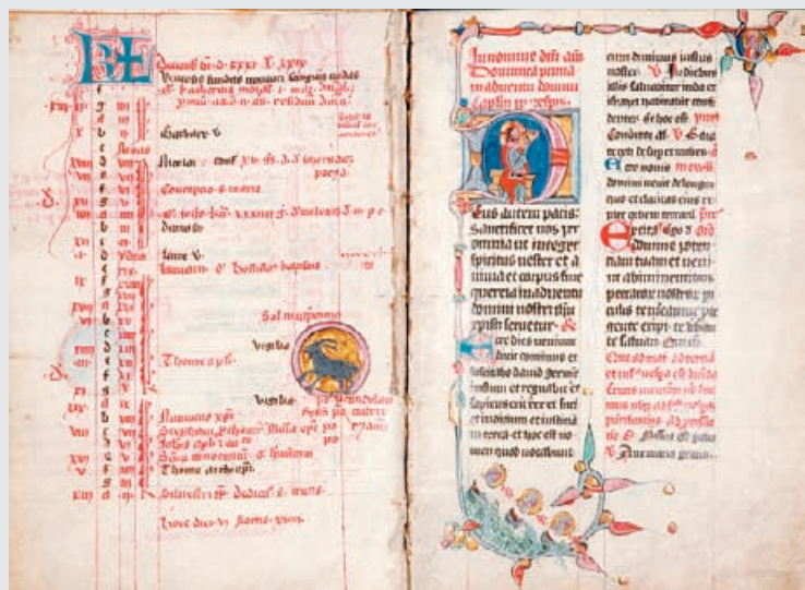
fol. 6v-7r: Kalendář (kozoroh)+Zobrazení Krista

Naivita zobrazení zvířetníkového znamení Kozoroha se stírá zajímavými drobnými zvířecími výjevy v okrajích listů druhé zobrazené iluminace. Rukopis sám o sobě nese výpověď o uměleckém prostředí kláštera benediktinek u sv. Jiří na Pražském hradě, z jehož skriptoria již několik rukopisů bylo veřejnosti představeno.