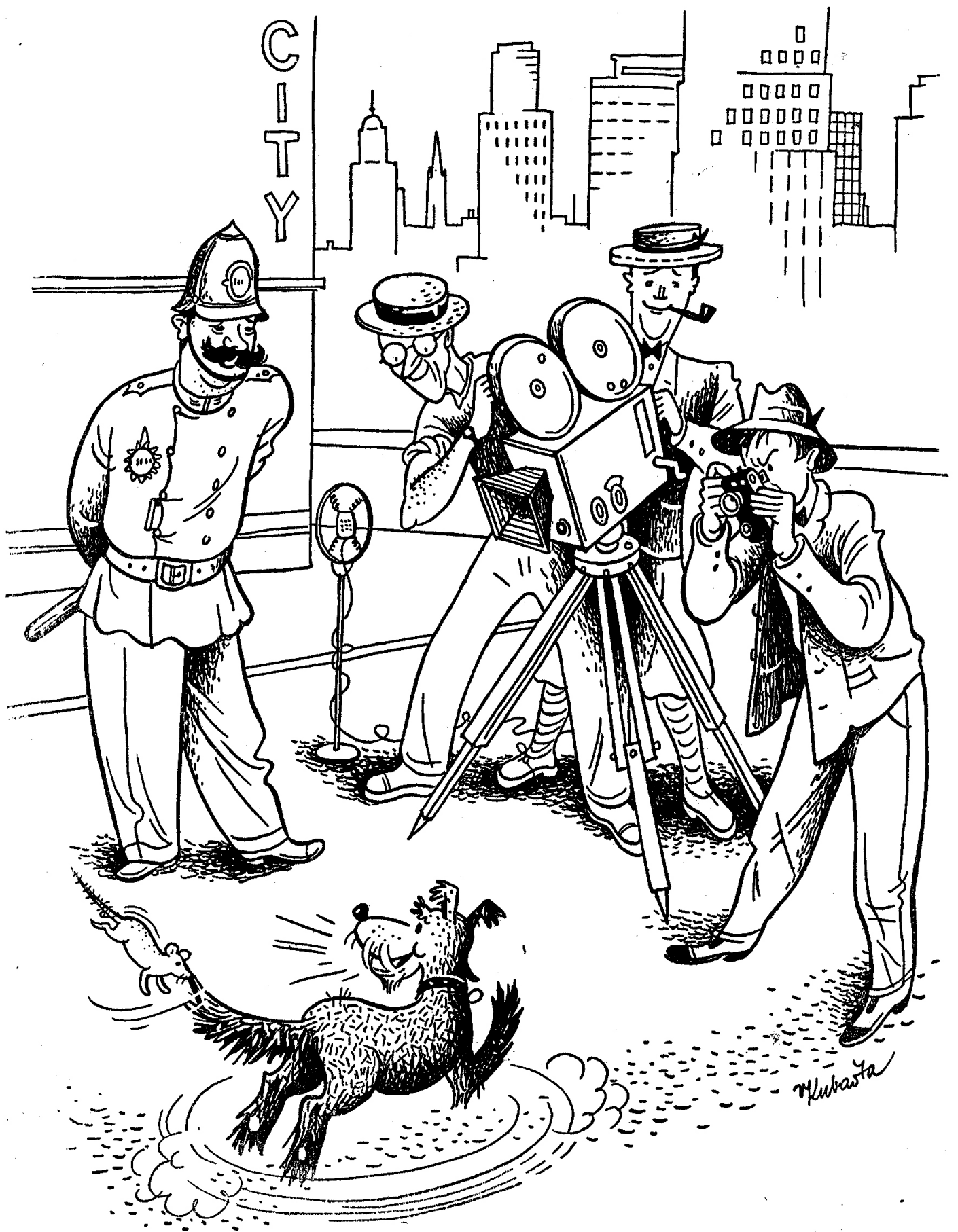
Filmování zvířátek v New Yorku.