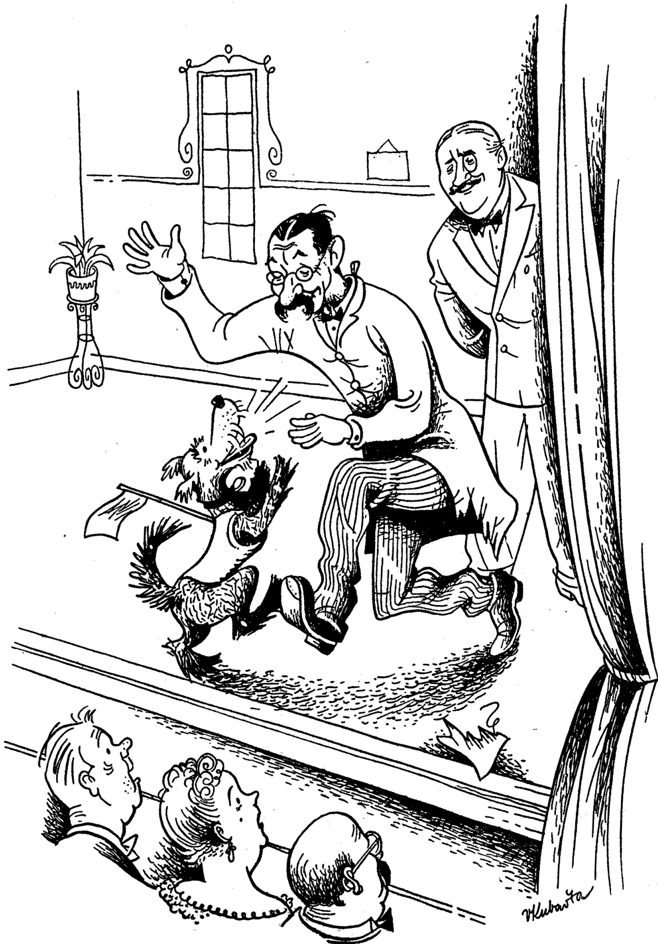
Burian na jevišti.