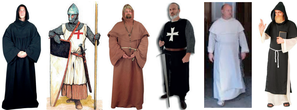
benediktýni, dominikáni, františkáni, maltézský řád, cisterciáci, premonstráti, řád templářů a další